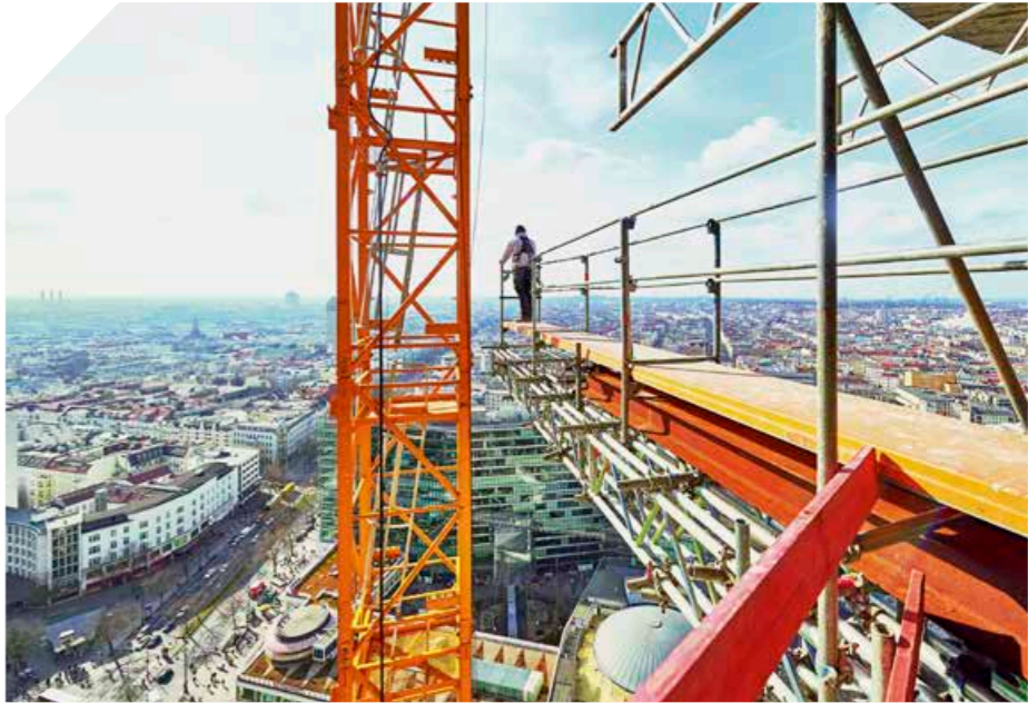
▲ In luftiger Höhe: Beim Bau des Hochhauses »Upper West« galt es, schwindelfrei zu sein

Die Ed. Züblin AG als erfahrener Generalunternehmer übernahm die Umsetzung des Projekts. Eine der zahllosen Herausforderungen war die Abdichtung der Restaurantküchen in der 10. Etage des Hochhauses. Dazu kamen sechs Müllräume in der 3. und 7. Etage sowie zwei Technikzentralen in Zwischengeschoßen – eine Gesamtfläche von knapp 2000 m 2 . >>>