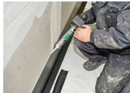
▲ Sicher gegen Hinterläufigkeit: Obere Versiegelung des Edelstahlverbundprofils mit Silikon

In Restaurantküchen kommt es auf absolute Hygiene ebenso an wie auf Sicherheit für die Bausubstanz. Hier fallen naturgemäß Fette und Öle an. Sie schlagen sich über den Kochdampf auf allen Flächen nieder. Durch Risse in Fugen und Fliesen, die eventuell im Lauf der Zeit entstehen, können aggressive Reiniger, Nahrungsfette und -öle in den Bodenaufbau eindringen. Wie von einem Schwamm werden sie vom Estrich und, wenn die untere Abdichtungsebene fehlt, auch von der Tragkonstruktion aufgenommen. Bei der (bio-)chemischen Reaktion mit Ölen und Fetten durch Mikroorganismen entsteht als Abbauprodukt Milchsäure, die erst den Beton und später auch die inneren Bewehrungsseile angreift. Das kann zu statischen Problemen führen.