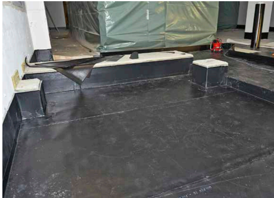
▲ Schwarze Wanne: Eine Kunststoffabdichtung schützt die Bausubstanz zuverlässig vor Fett und Öl