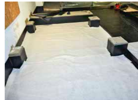
▲ Als Schutzlage haben die Dachdecker auf der Kunststoffabdichtung ein Vlies verlegt

Um die Betontragkonstruktion vor Kontamination und Wechselwirkungen durch Milchsäure und Reinigungsmittel zu schützen, muss die untere Abdichtungsebene einen lückenlosen Bauwerksschutz in Form einer Wanne mit hohen technischen Eigenschaften bieten, insbesondere durch hohe Dehnfähigkeit setzungstolerant und