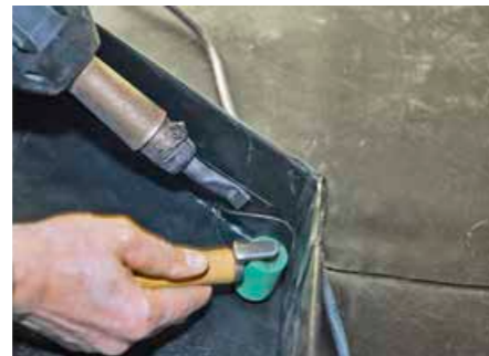
▲ Sicherheit im Detail: Heißluftverschweißung eines Formteils an einer Innenecke

Um maximale Sicherheit zu erreichen, ist also eine professionelle Abdichtung in zwei Ebenen anzuraten – eine typische Aufgabe für das Dachdeckerhandwerk.